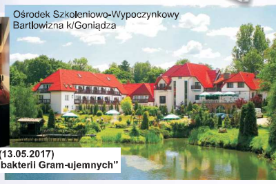
POSIEDZENIE NAUKOWO-SZKOLENIOWE (13.05.2017) „Problemy oporności na antybiotyki wśród bakterii Gram-ujemnych”